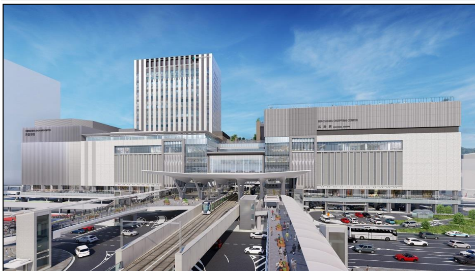
広島駅南口広場全景